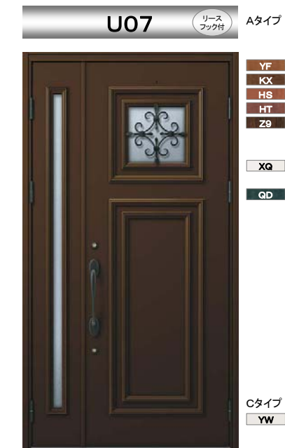
B1 : ブラウン