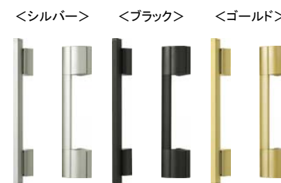
(外観) (内観) (外観) (内観) (外観) (内観)