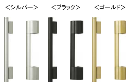
(外観) (内観) (外観) (内観) (外観) (内観)