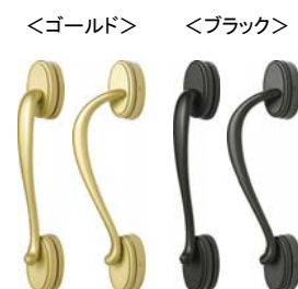
(外観) (内観) (外観) (内観) (外観) (内観)