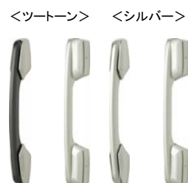
(外観) (内観) (外観) (内観)