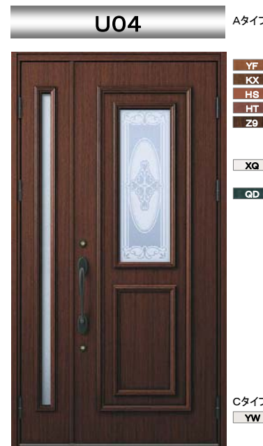
HT : ローストマホガニー