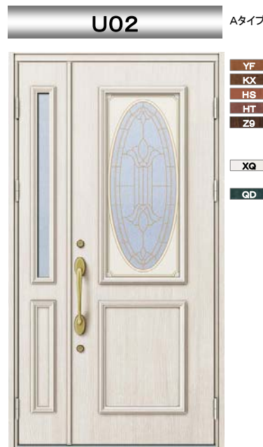
XQ : ホワイトウッド