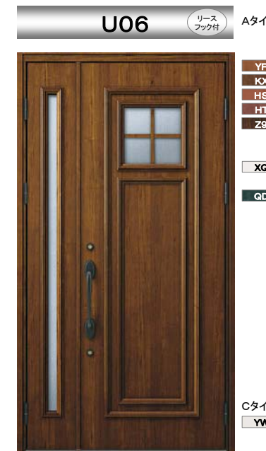
YF : キャラメルチーク